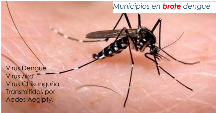
Municipios en brote dengue